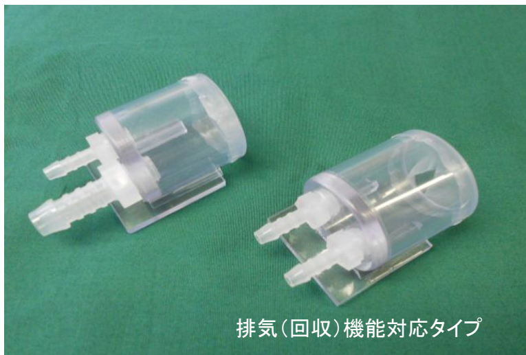
排気(回収)機能対応タイプ