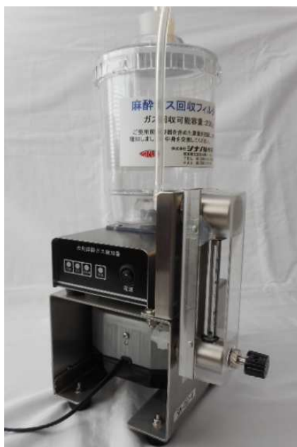
卓上型麻醉ガス回収装置 SN-489-4 への組み込み