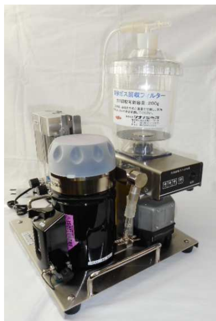
実験動物麻醉装置SN-487-0T Air 回収機能付きへの組み込み