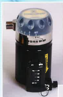
セボフルラン気化器