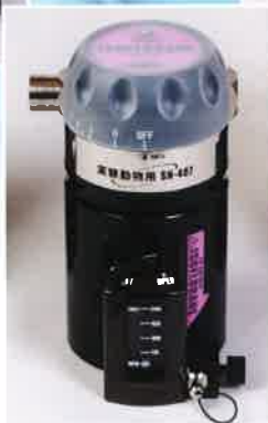
イソフルラン気化器