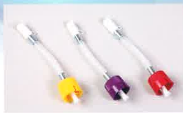
キーフィルター注入器