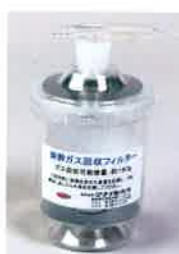
麻酔ガス回収 フィルター用容器

SN-487-60 接続コネクター付き 直径125×H190mm 部品は分解・洗浄が可能