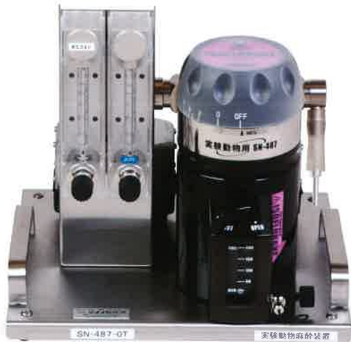
SN-487-OT Air 回収機能付き