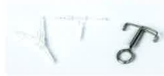
分岐コネクター ピンチコック