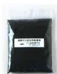
麻酔ガス回収 フィルター吸着剤

SN-487-60 接続コネクター付き 直径125×H190mm 部品は分解・洗浄が可能