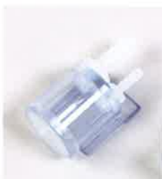
マウス・ラット用 麻酔マスク